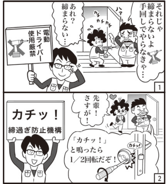
このマンガはフィクションです。実在の人物や団体などとは関係ありません。