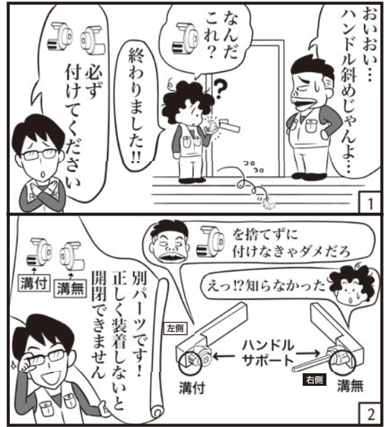
このマンガはフィクションです。実在の人物や団体などとは関係ありません。