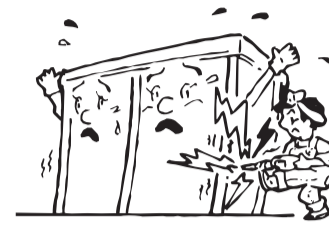
●改造しないでください。