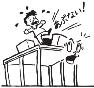
●屋根の上には乗らない、載せない、ぶらさがらない。