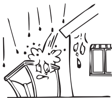
大屋根からの雨水が落ちるところには設置しないでください。