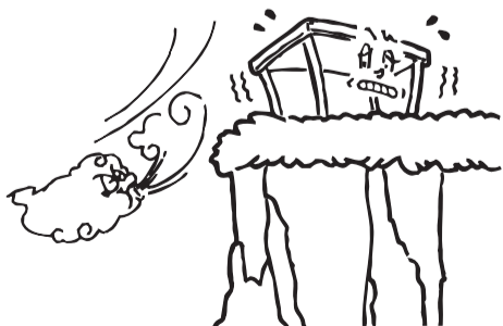
崖のふちには設置しないでください。