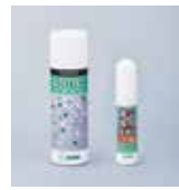
錠前潤滑スプレー 3069 【右側左】スプレー3069(内容量70ml) 【右側右】スプレー3069S(内容量12ml) ※業務用スプレー3069L(内容量480ml)も あります。

錠前潤滑剤「3069」は美和ロックサービス代行店で販売しております。詳しくはお問い合わせください。弊社サービス代行店はホームページから検索できます。 美和ロックホームページ https://www.miwa-lock.co.jp/